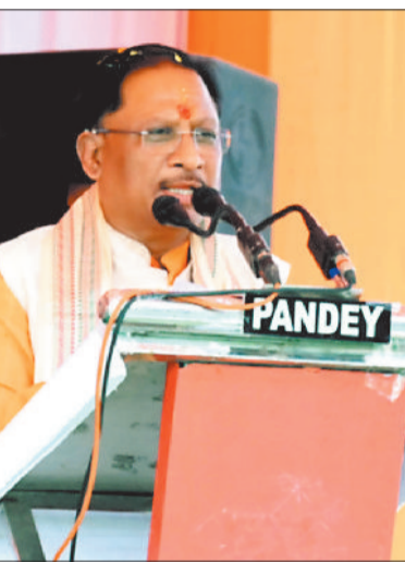
कार्यक्रम को संबोधित करते मुख्यमंत्री।