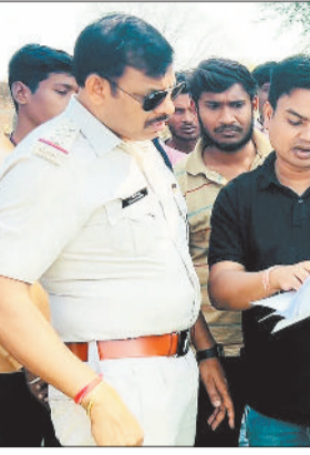
हरिभूमि न्यूज >> घरघोड़ा