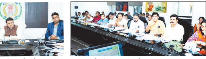
वन विभाग की समीक्षा बैठक में मौजूद कलेक्टर, सीईओ व अन्य अधिकारी।