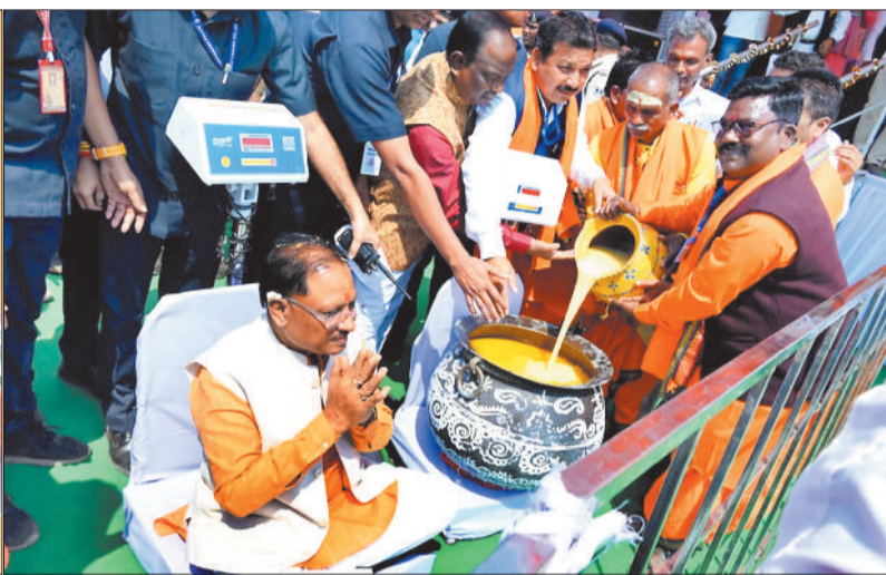
मुख्यमंत्री को धी से तौला यादव समाज ने।