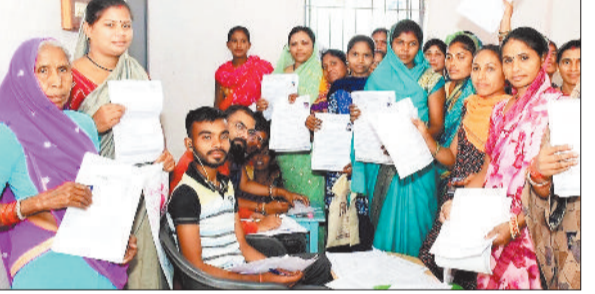
हरिभूमि न्यूज >> रायगढ़

महतारी वंदन योजना का लाभ पाने के लिए 29 फरवरी तक 2 लाख 7 हजार 452 विभाग को प्राप्त हुए हैं। इन आवेदनों में 232 आवेदनों पर दावा आपत्ति प्राप्त हुई थी, जिसका विभाग द्वारा निराकरण किया गया है। वहीं पूर्व पेंशनधारियों से प्राप्त 65 हजार आवेदनकर्ताओं के आवेदनों का सत्यापन किया जा रहा है।